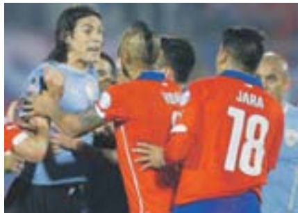
Gonzalo Jara (18) fue sancionado por su agresión a Edinson Cavani. (A)

Busque más información en www.panorama.com.ve