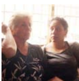
El sepelio de la estudiante será hoy en "El Cuadrado".

La estudiante de Educación Inicial se inundaba hoy, a las 10:00 am, en el cementerio El Cuadrado, en la avenida Delicias. "Ella era una muchacha que soñaba con ser maestra de preescolar. Estaba llena de sueños, era muy feliz, y su esposo la adoraba, tenían una relación muy bonita, muy amorosa", dijo la abuela.