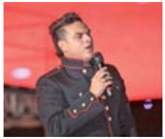
El tour Sigo Invicto 360 grados hace triunfar al popular intérprete de "La gringa".

Silvestre Dangond, el showman del momento, es uno de los artistas que arrastra masas en Latinoamérica y hace poco se presentó en Antiba llenando el estadio Elites Masur Ball Park. En junio, el idolo de "La gringa" estuvo en Panamá, Chile y Ecuador con su Tour Sigo Invicto 360 grados, causando algarabía entre sus seguidores. A Venezuela le toca el turno en julio y precisamente será el Palacio de Eventos del escenario que lo recibe este sábado 4 de julio en Maracaibo. El nuevo tour comenzó el 8 y 9 de noviembre de 2014 en el Forum de Valencia, logrando agotar dos funciones. Este formato llamado 360 grados fue una idea original del productor y director de escenografía Basilio Orta Paz, presidente de Apushana Producciones,