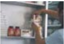
El sistema está diseñado para anotarse en farmacias y esperar el medicamento. |V. Mejía

A dos meses de informarse sobre el Sistema Integral de Acceso a los Medicamentos (Siamed), nuevo mecanismo para adquirir los medicamentos para patologías crónicas, en el Zulia, los pacientes aún continúan a la espera de que lleguen sus fármacos. El sistema está diseñado para anotarse en farmacias y esperar la llegada del medicamento. La cámara de farmacias asegura que no hay suficientes inventarios para atender demanda. • actualidad 3